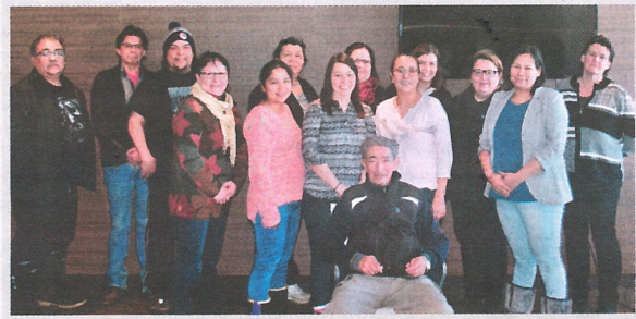
Quelques participants présents lors de la rencontre du 15 février 2016.

Vous êtes invités à consulter le site web et à partager sur Facebook. Tous ceux et celles qui ont des suggestions, commentaires ou questions, peuvent le faire directement à partir du site web. Nous vous invitons à vous exprimer sur le travail qui a été réalisé par le