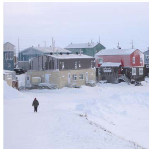
Puvirnituk, janvier 2017

Tous les partenaires y sont les bienvenus !