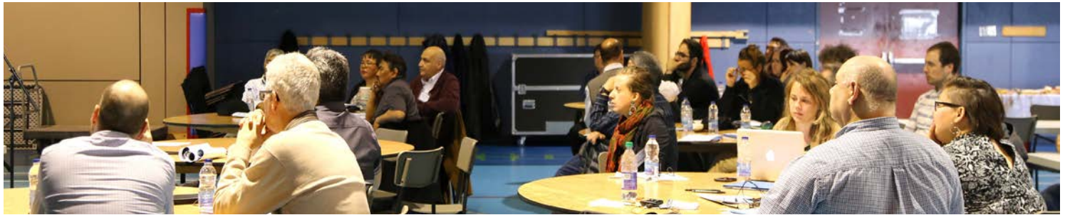
Assemblée générale à Kuujuaq, juin 2016

Pour rappel, le partenariat Habiter le Nord québécois (HLNQ) a pour sujet d'étude l' aménagement culturellement approprié et durable de l'habitat des communautés innues du Nitassinan et inuit du Nunavik . Il aborde les milieux de vie et l'habitat autochtones nordiques dans toute leur complexité en examinant les trois dimensions qui les structurent, leur donnent un sens et en orientent le développement, soit les communautés, les cadres de vie et la gouvernance. Vous pouvez lire notre résumé de projet ici : en français ou en inuktitut .