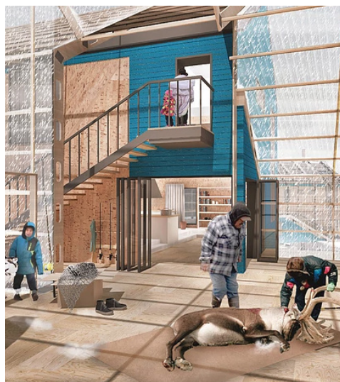
Habiter ensemble, projet d'atelier (projet : A.Boulanger-C., P-O.Demeule et M-C.Gravel)