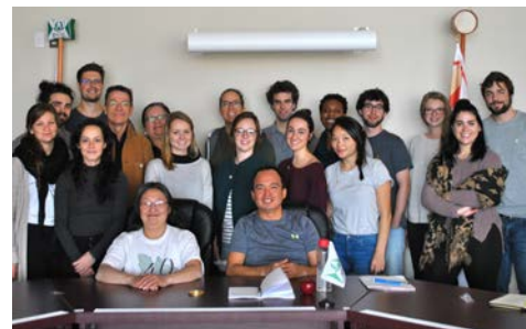
Rencontre avec ITUM, Uashat, Atelier d'André Casault, octobre 2016