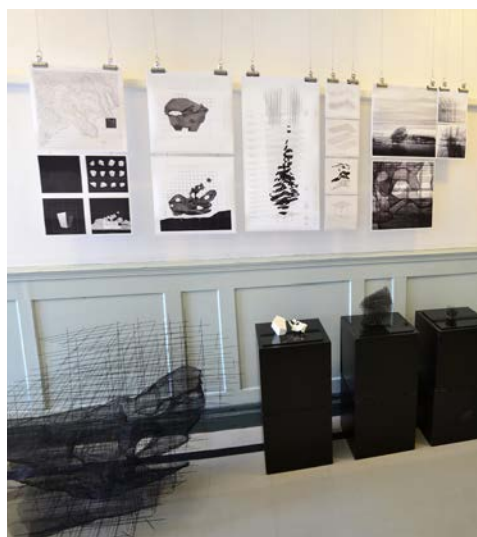
Pavillons extérieurs pour les jeunes de Kuujjuaq, exposition (projet : A.Marceau et V.Tessier)