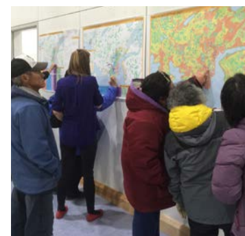
Consultation publique à Inukjuak, septembre 2016

Plus d'informations sur les projets seront disponibles dans les prochaines semaines.