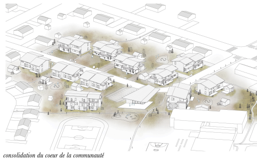
consolidation du coeur de la communauté

Le projet souhaite articuler les habitations autour d'espaces communautaires afin de favoriser les interactions sociales tout en permettant une gradation entre l'intimité et les lieux de sociabilité. Il souhaite également offrir une variété de types d'habitation adaptés aux besoins de clientèles variées en alternative à l'offre existante.