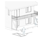
un porche à portée de main